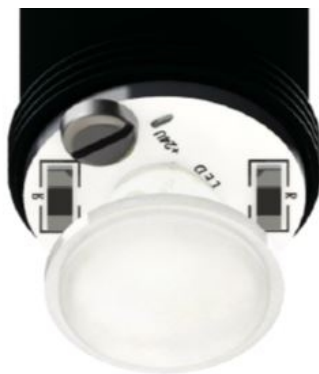
CM17826 LED modul 2,5W 24VDC without optic 2700K PCB5050 2.524 927