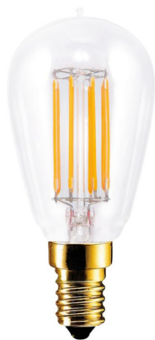
CM5563 Segula E14 LED filament EU 2200K 4,7W 400lm 220-240V