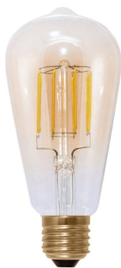
CM5566 Segula E27 LED filament 6W 350lm 220-240V dimmable